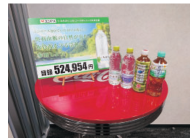
寄付金目録と対象商品

令和六年一月九日、いわて農林水産躍進大会が岩手県民会館にて開催され、その大会内で、当地区では、昨年度に引き続き四度目の受賞となる岩手県アドプト活動モデル賞を受賞いたしました。