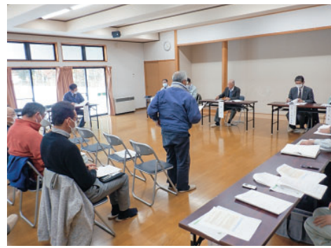
質問をする受益者

令和五年十二月二日、県営経営体育成基盤整備事業鍋割地区の受益者総会が、鍋倉ふれあい交流センターにおいて開催されました。 鍋割地区は、未整備地区で一反歩程度の不整形小区画であり、農道幅員が狭小で、大型機械等による作業体制の確立を阻害しておりました。また、農地の分散化による低い生産性や用排水兼用の土水路により水管理に多大な労力を要しておりました。