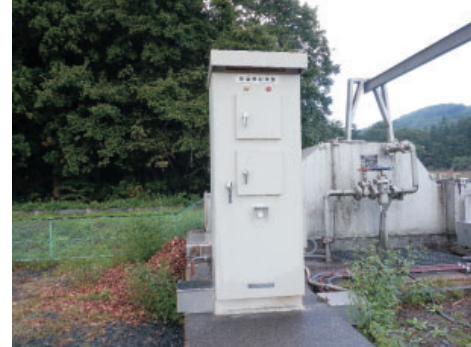
上：大畑2揚水機電動弁 下：鍋倉除塵機操作盤