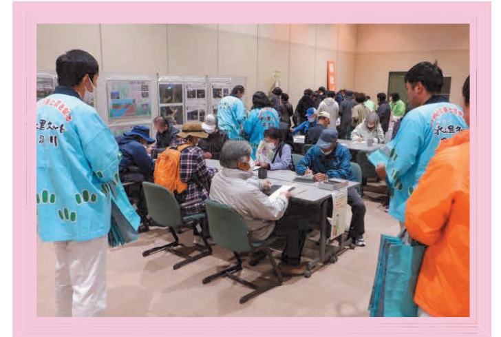
水土里ネットフェスタ