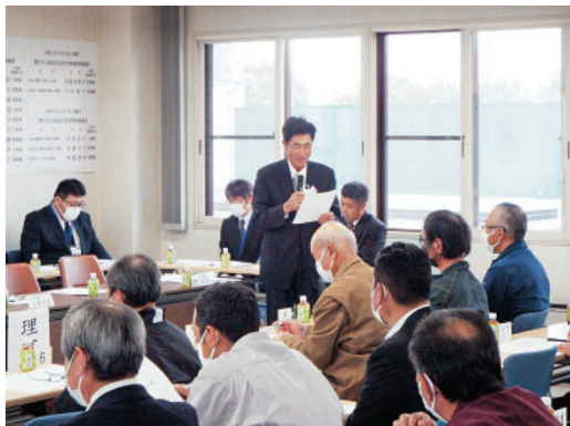
選挙管理者を務める農事組合法人HHA泉畑総代 (中央)