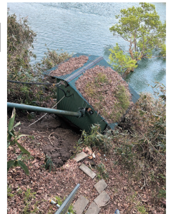
獅子鼻揚水機場 (左: 全景 右: 地滑り状況)