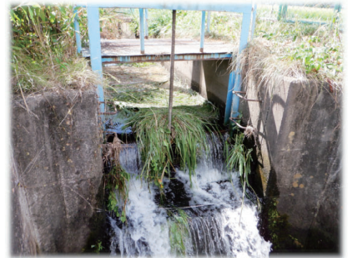
中央用排水路ゲート (令和5年度)