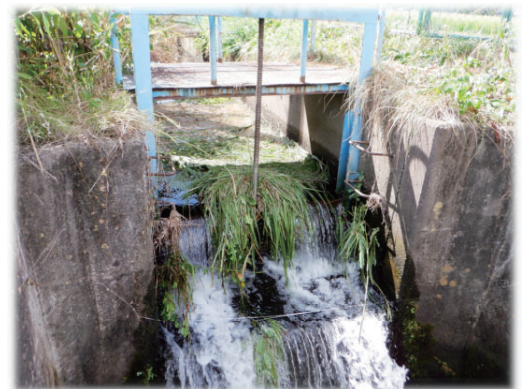
中央用排水路ゲート

また、農作業時に、誤って給水栓を破損してしまう事故が発生しております。給水栓は個人の所有物であるため、修理の際には個人負担となり、場合によってはすぐに修理をすることが出来ません。十分に注意していただきますようお願いいたします。