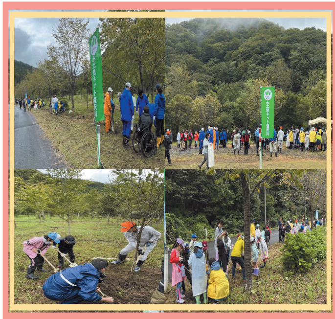
豊沢川の森植樹祭