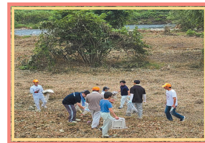
豊沢川クリーン作戦