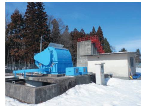
鍋倉2除塵機 (サイクロ減速機更新 他)