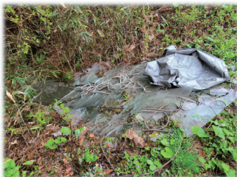
北湯口地内水路敷地