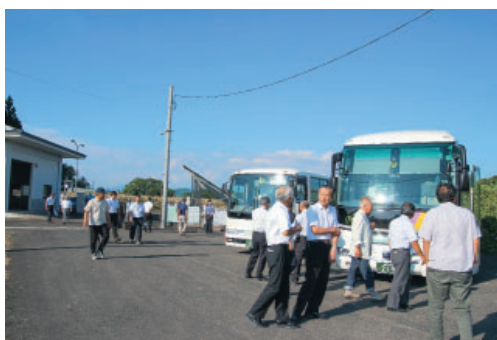
管内施設研修 (宮野目揚水機場)