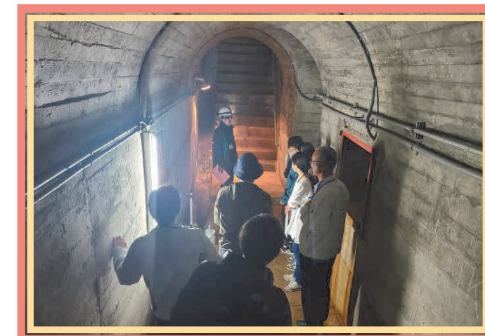
岩手大学現地施設見学