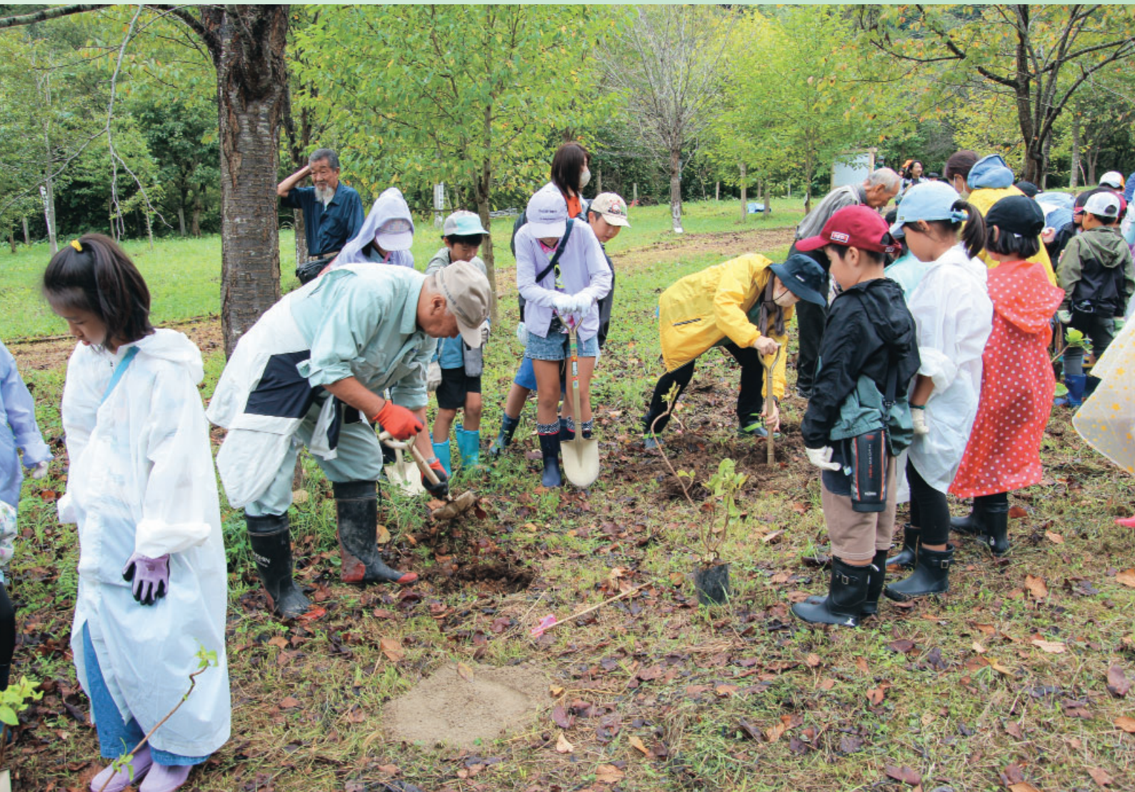
3年ぶりに開催された「水土里ネット豊沢川の森植樹祭」

地区面積：4,999 ha 組合員数：3,174 名 准組合員数：621名 (令和5年4月1日 現在)