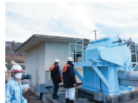
狼沢補水除塵機 (サイクロ減速機更新 他)